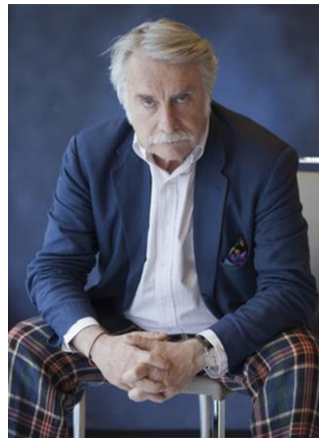
Paolo Crepet a LeXGiornate in Cattolica, alle 18 in via Trieste

La seduzione del coraggio. Titolo enigmatico, antitetico, curioso. Come può un mondo sempre meno coraggioso farsi sedurre dal coraggio e metterlo in pratica come antidoto per la sua stessa decadenza? Prima di spiegarlo al pubblico de LeXGiornate (questa sera in via Trieste, dalle 18 in poi, con ingresso a 6,50 euro), Paolo Crepet ne ha parlato in anteprima a Bresciaoggi. Lo ha fatto un secondo dopo aver disciolto nella pioggia bresciana una lieve dichiarazione d'amore per una città che lo vede spesso protagonista di dibattiti e approfondimenti. «Brescia è una città che ho frequentato molto, una città bellissima con un pubblico meraviglioso. Sono contento di tornarci per l'ennesima volta, di rivivere l'atmosfera del Festival e poter incontrare, sabato mattina, i ragazzi».