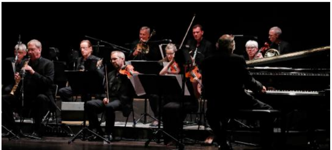
I musicisti hanno dimostrato una sensibilità raffinata nel corso di una prova audace