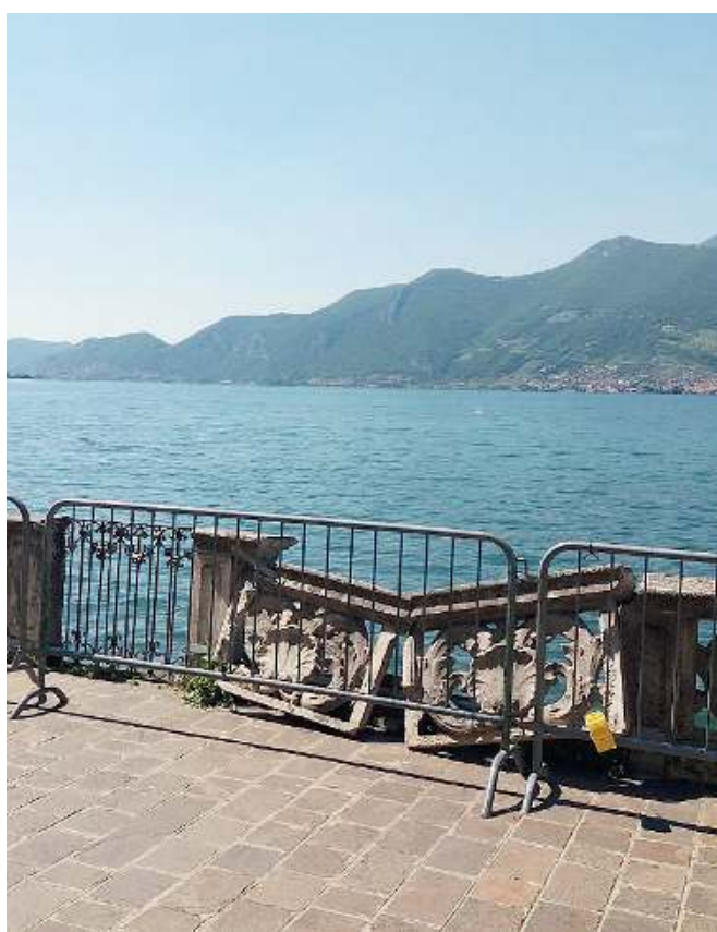
Dopo la lagheggiata. I danni sul lungolago d'Iseo, nel maggio scorso

A Iseo. Non figura tra i beneficiari per il 2020 il Comune di Iseo, che aveva inserito la manutenzione del lungolago tra i lavori per l'anno in corso, con la richiesta di 400mila euro. La scorsa primavera la passeggiata del lungolago Marconi aveva subito grossi danni a causa delle violente lagheggiate, tanto da dover anticipare alcune opere di rattoppo ad inizio estate, pena la non accessibilità del percorso. Con il cambio di amministrazione, le opere dedicate al lungolago sono aumentate di importo, come conferma il sindaco di Iseo Marco Ghitti: per il momento la cifra appostata per il 2021, su cui chiedere il finanziamento, è sempre di 400mila euro, ma sarà destinata ad aumentare, come conferma Ghitti: «Per il completo consolidamento del lungolago dai giardini Garibaldi al porto Gabriele Rosa servono un milione 200mila euro. L'Amministrazione di Iseo programmerà i lavori in due tranches da 600mila euro ognuna per il